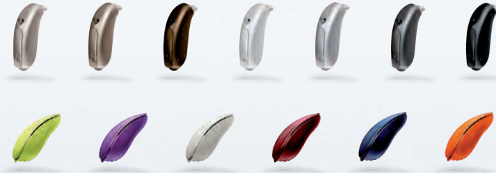
Oticon Hörgeräte erhalten Sie in vielen Farben und Formen.