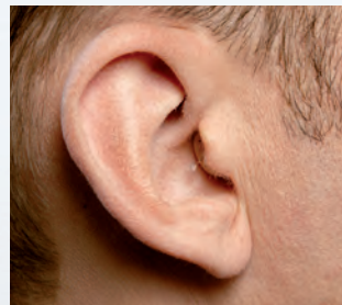
Im-Ohr-Gerät, das nahezu unsichtbar im Gehörgang sitzt