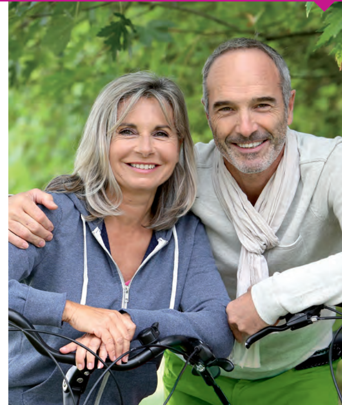
MODERNE HÖRSYSTEME VON OTICON

91000555 / D-Hamburg-8.2014. Änderungen, Irrtümer und Abverkauf vorbehalten.