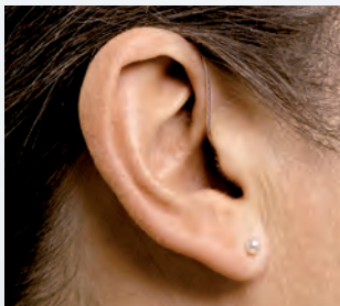
Hinter-dem-Ohr-Gerät mit ausgelagertem Lautsprecher